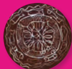
Maelbeek Mon Amour

Lettre d'information pour le quartier Nieuwsbrief voor de wijk Nje leter me informata per kete lagje Mahalle için bildiri mektubu رسالة إخبارية لحيكم Pismo informacyjne dla dzielnicy