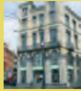
Contrat de quartier Navez-Portaels Wijkcontract Permanente Permanente

Contrat de quartier Navez-Portaels Wijkcontract Place Verboekhoven 9 Verboekhovenplein Angle Hoek Pr. Elisabeth Tel. 02 246 91 65 Fax. 02 216 27 73