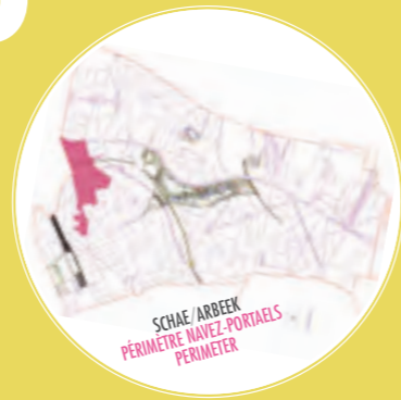
SCHAE/ARBEK PÉRIMÈTRE NAVEZ-PORTAELS PERIMETER